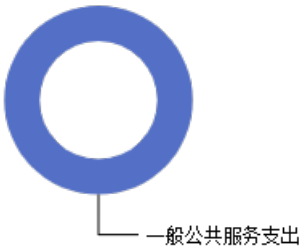
一般公共预算当年拨款结构图

2023 年度一般公共预算基本支出 6.43万元，其中： 人员经费 0.00万元，主要包括：； 公用经费6.43万元，主要包括：邮电费、办公费、维修(护)费、公务接待费、差旅费等。