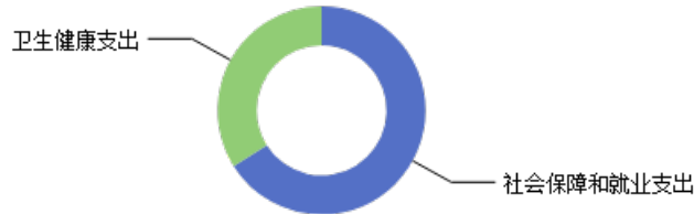
一般公共预算当年拨款结构图

2023年度一般公共预算当年拨款539.99万元,主要用于以下方面:社会保障和就业支出356.66万元,占66.05%;卫生健康支出183.33万元,占33.95%。